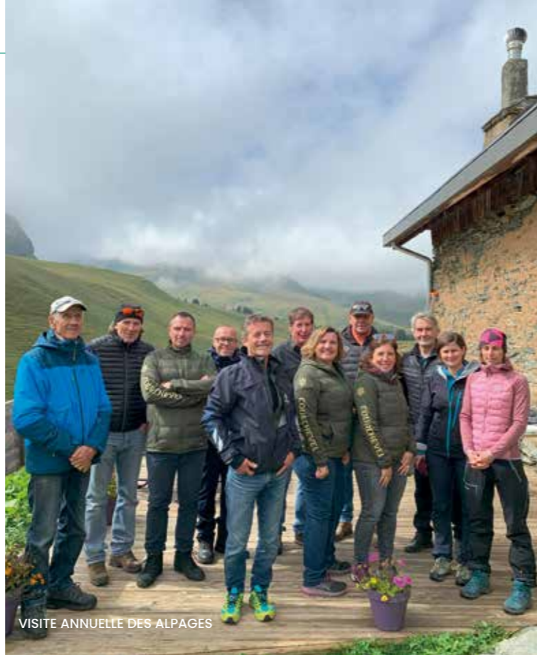
VISITE ANNUELLE DES ALPAGES