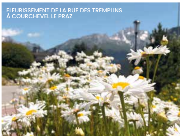
FLEURISSEMENT DE LA RUE DES TREMPINS À COURCHEVEL LE PRAZ