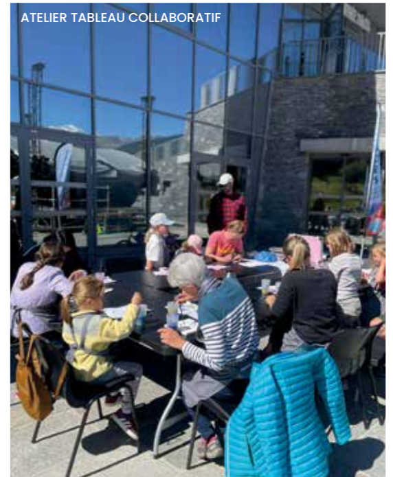
ATELIER TABLEAU COLLABORATIF

La conférence a transporté l'audience au