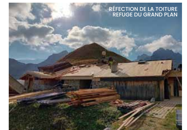
RÉFECTION DE LA TOITURE REFUGE DU GRAND PLAN