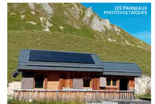
LES PANNEAUX PHOTOVOLTAÏQUES